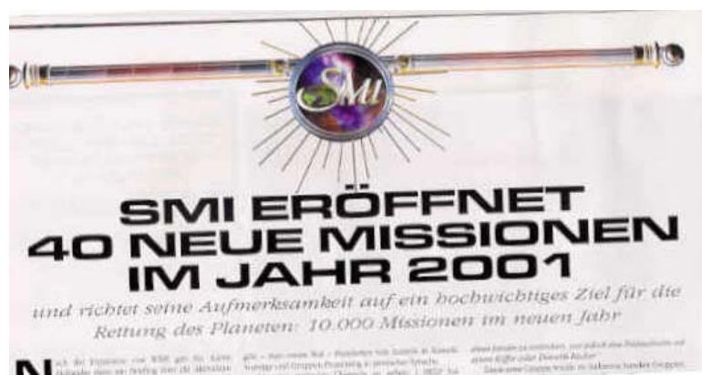
Bilder oben: Scientology News-Ausgabe 20/2002, Deckseite und Seite 14 (Auszug)