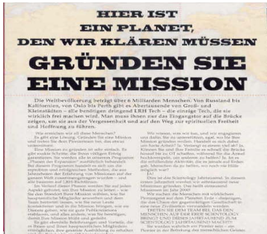
Bilder oben: Scientology News - Magazin, Ausgabe 12/2000, Deckseite und Seite 30

Mit der Gründung einer Mission und dem Beitritt zu einem „Pionierteam das etwas unternimmt“, wird dieses Ziel erreichbar sein, so der Bericht. Es wird versprochen, dass es „sehr einfach“ ist, „eine Mission zu gründen“.