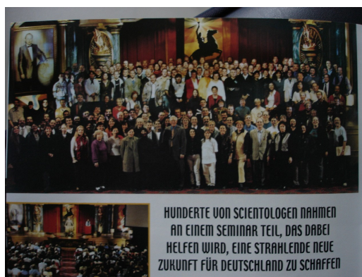
Bilder oben: Impact Ausgabe 93/2000, herausgegeben von der IASA (Deckblatt) und Auszug Seite 52