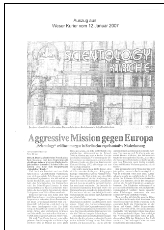
Bild oben: Auszug aus Weser Kurier vom 12.01.2007 (13)

Anlässlich der Neueröffnung der Berliner Scientology Org im Januar 2007 berichteten auch viele Presseorgane darüber.