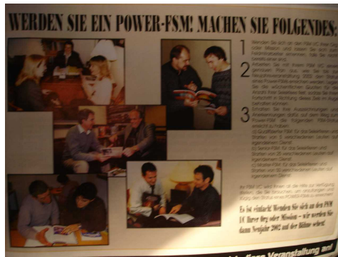
Bilder oben: Scientology News Nr. 15/2001 Deckblatt und Auszug Seite 19, herausgegeben von der CSI (Church of Scientology International)

Der Executive Direktor International der Scientology-Organisation meinte dazu: